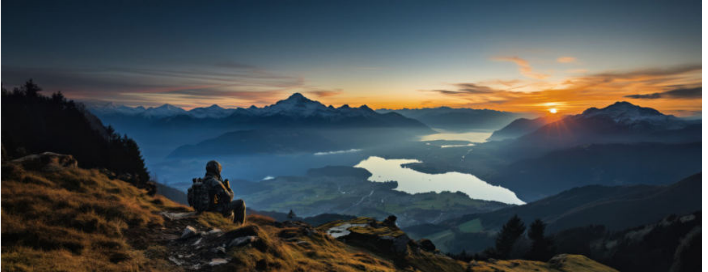
KI-generiertes Bild, Schweizer Landschaft